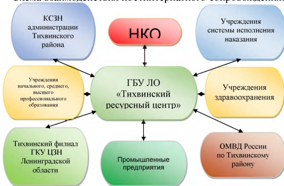
Схема взаимодействия постинтернатного сопровождения.

В учреждении организованы условия для временного бесплатного проживания выпускников до 23 лет в «Социальной квартире».